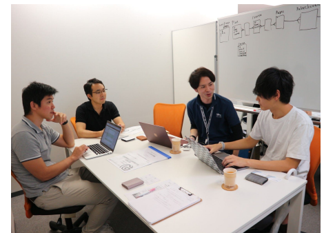
サービス開発会議の様様

2017年5月に設立した、AIパッケージ販売・受託開発および競馬予想AIの開発・運営を行うスタートアップ企業。レディースファッション大手ANAPとAI・自然言語処理技術を活用したEC・マーケティング技術の共同開発やAIの画像解析を用いたファッションEC販売向け・動画編集システム「Zoom（ズーム）」を手掛ける。